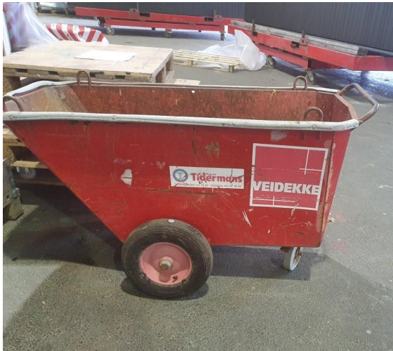
Figur 13, Fodervagn, egen bild.

Användningsområde: För att samla t.ex. spill bitar från kapningar som man sedan kan rulla bort till avfallsstationen på arbetsplatsen smidigt. Då en ren arbetsplats bidrar till en säkrare arbetsplats.