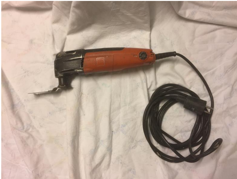
Figur 5, Multiverktyg, egen bild.

Användningsområde: Detta verktyg kan användas på olika sätt t.ex. vid sågning och slipning. Den används framförallt när man inte kommer åt med andra verktyg då multiverktyget är väldigt smidigt och har många olika egenskaper.