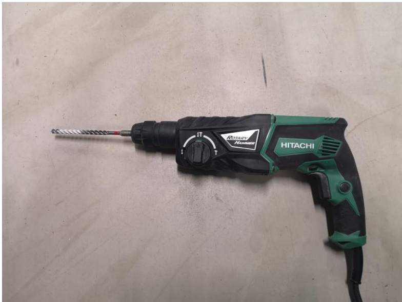
Figur 6, Borrhammare, egen bild.

Användningsområde: Vid borrar och lättare bilning i betong.