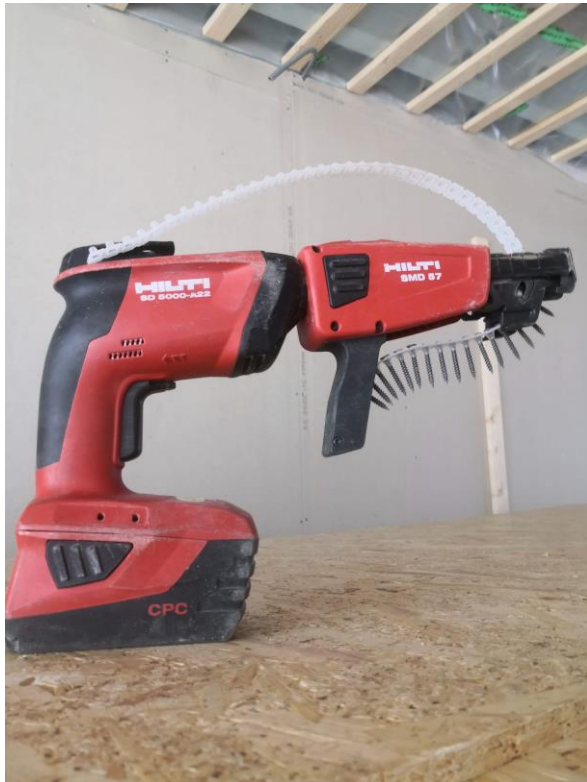
Figur 15, Skruvautomat.

Användningsområde: En automatiskskruvdragare som ofta används vid gipsskivor, då det går mycket fortare än att använda en vanlig skruvdragare.