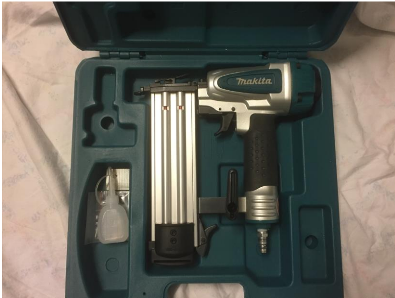
Figur 7, Dyckertverktyg, egen bild.

Användningsområde: En typ av spikpistol som används till noggrannare arbeten när spiken inte ska vara för stora (dyckert/listspik), t.ex. när man spikar fast lister och foder.