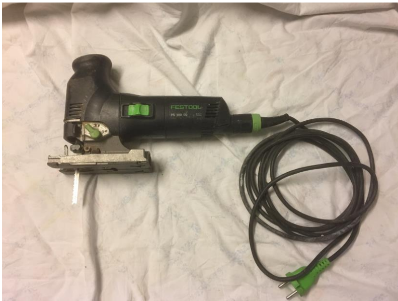
Figur 2, Sticksåg, egen bild.

Användningsområde: Används vid kapning, klyvning eller figursågning av tunnare material.