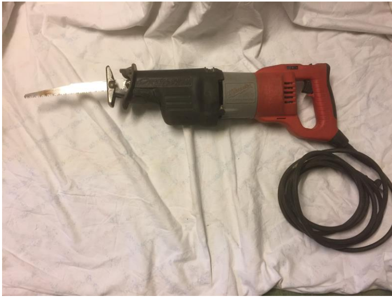
Figur 3, Tigersåg.

Användningsområde: Används ofta vid kapning, rivningsarbeten och figursågning när det är tjockare material än när sticksågen används.