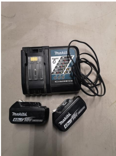
Figur 14, Batteripaket, egen bild.

Information: Vid köp av maskiner köps oftast bara maskinen löst utan batteri för att man inte behöver så många batterier, istället då köper man ett batteripack som man kan använda till alla maskiner som man har. Vid hyrning av maskiner ingår batteri i priset.