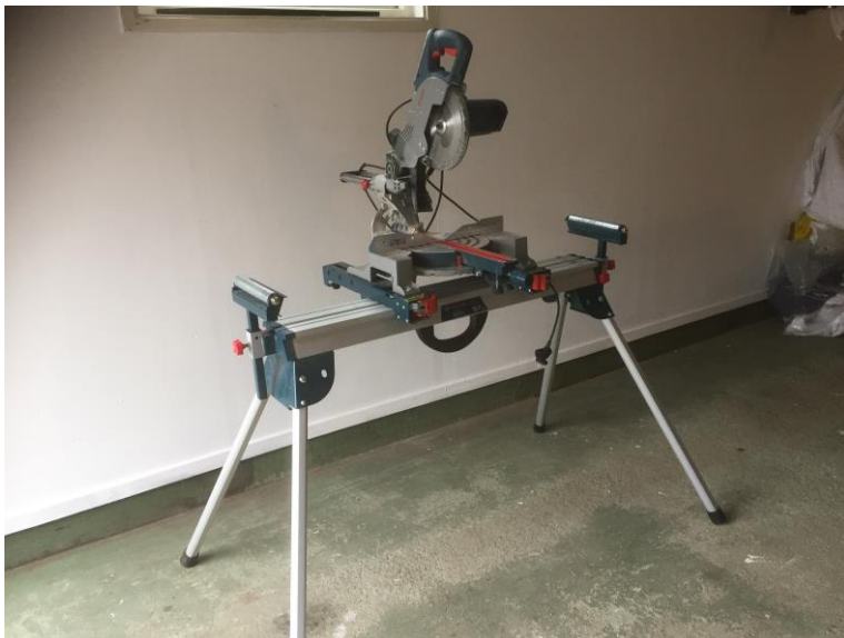
Figur 10, Kap- och gersåg, egen bild.

Användningsområde: För att kapa brädor/plank på längden.