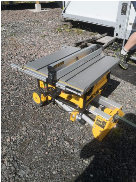
Figur 11, Klyvsåg, egen bild.

Användningsområde: För att klyva t.ex. brädor/plank på bredden.