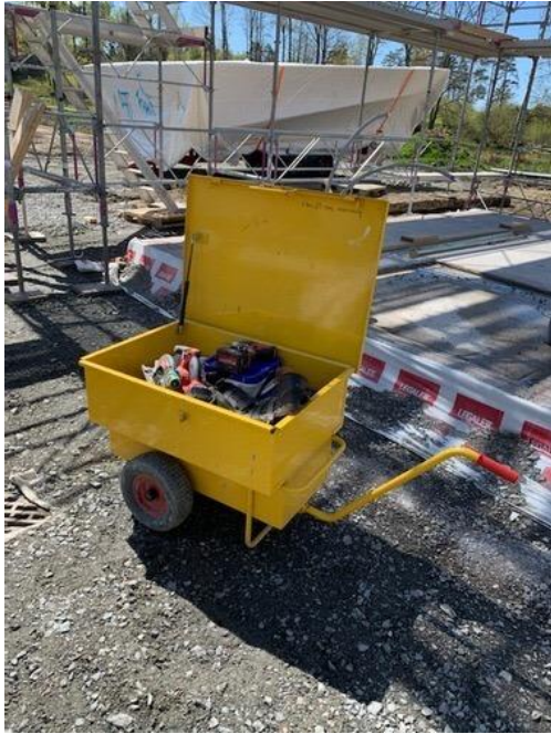
Figur 9, Verktygsvagn.

Användningsområde: För att man ska kunna samla alla maskiner på ett och samma ställe när man går runt i byggnaden och även låsa in verktygen under nätter och helger.