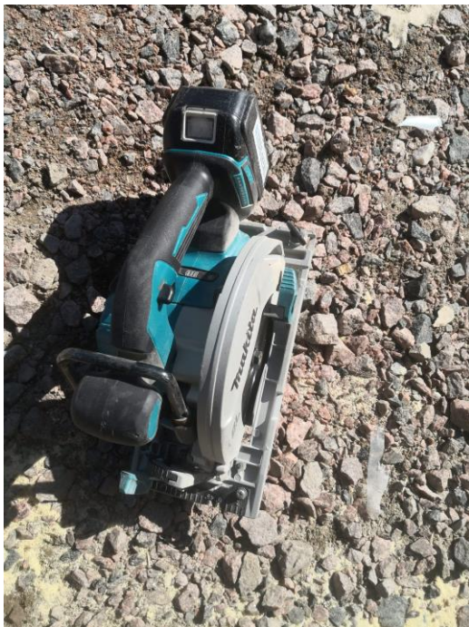
Figur 4, Cirkelsåg, egen bild.

Användningsområde: Vid kapning eller klyvning av olika material, t.ex. OSB-skivor.