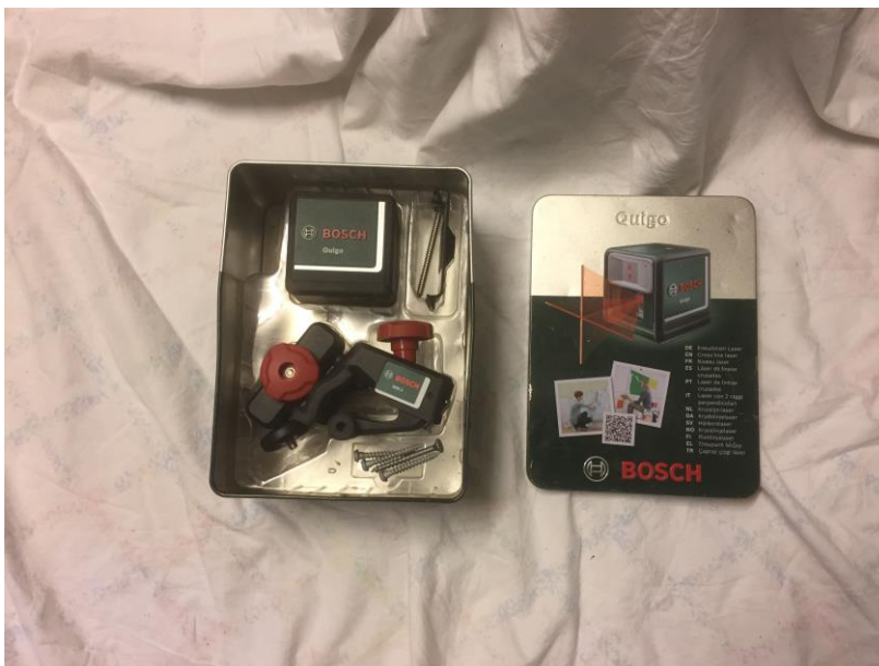
Figur 8, Korslaser/linjelaser, egen bild.

Användningsområde: En korslaser/linjelaser används som komplement till vattenpasset, då den kan visa både lodräta och vågräta linjer.