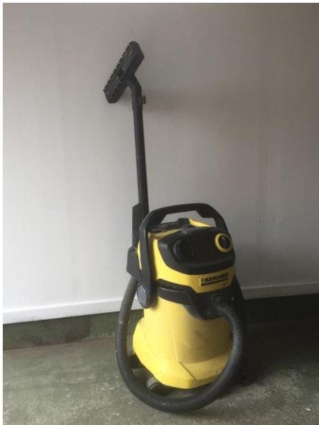
Figur 12, Industridammsugare, egen bild.

Användningsområde: Dels kan man ofta koppla dammsugaren på olika maskiner för att slippa dammet som blir, dels för att kunna städa och hålla en ren och snygg arbetsplats.