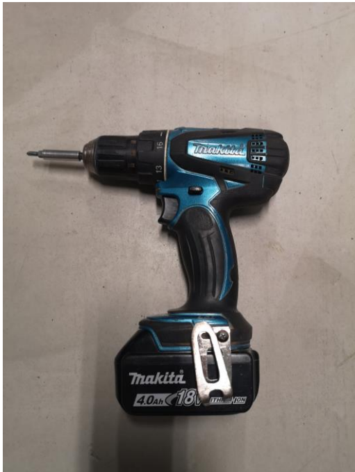
Figur 1, Skruvdragare, egen bild.

Användningsområde: Används framförallt vid skruvning och borrar.