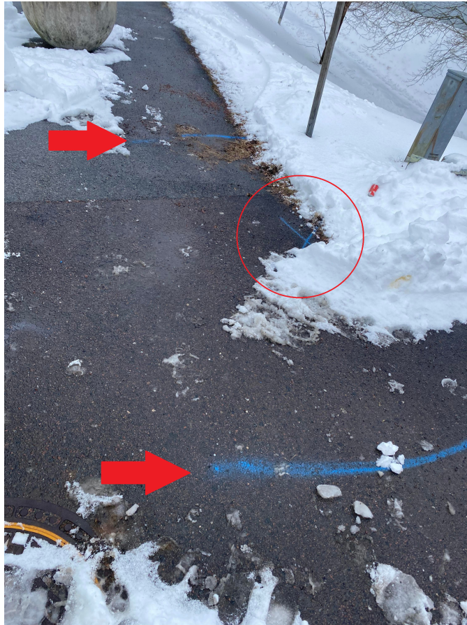
Figur 4. Platsen där läckan misstänks befinna sig. Pilarna visar läcksökningshundens markeringar och cirkeln visar driftteknikers markering.

Två veckor efter fältdagen grävdes den misstänkta läckan upp och det visade sig att den fanns på 1,8 meters djup där läcksökningshunden och driftteknikerna markerat. Läckan visas i Figur 5.