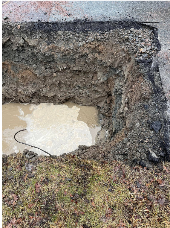
Figur 6. Ansamling vatten vid läckan.

En större ansamling av vatten fanns över hela grävområdet där läcksökningshunden markerade, se Figur 6.