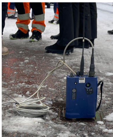
Figur 3. En av de två sändarna utplacerade i en servisventil.

Hunaidi (2012) förklarar korrelationsmetoden med att två sändare placeras på varsin sida av läckan, se Figur 3. Dessa mäter sedan ljudet från läckan och skickar informationen till korrelatorn. Därefter använder sig korrelatorn av längden mellan sändarna, ljudhastigheten och tidsskillnaden för att räkna ut läckans position. Hunaidi (2012) beskriver vidare att för att bestämma ljudhastigheten används rörets material och diameter, då olika material och rördiameter leder ljudet olika snabbt. Därför kan inte korrelation användas på exempelvis en gjutjärnsledning som lagats med plast. En annan begränsning med metoden är att ledningen måste kunna nås via brandposter eller annan typ av ingång (Malm et al., 2019).