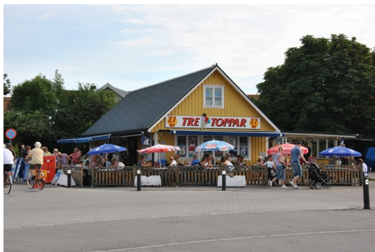
Bild 7. Tre Toppar, glasscafé, som lockar mängder av turister varje år (Loulas kök, 2010).