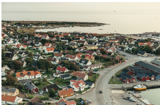
Bild 3. Flygbild över bebyggelsen närmast hamnen, Träslövsläges äldre delar.