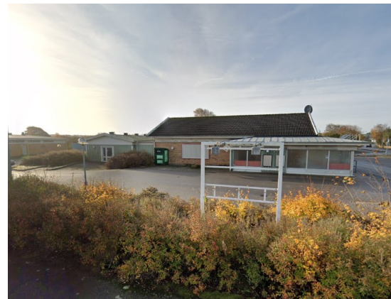
Bild 12. Nedlagda matbutiken

Området kommer att utvecklas och drygt 100 bostadsrätter ska uppföras. Målbilden är att bebyggelsen ska ha en tydlig anknytning till Träslövsläge med avsikt att spegla känslan av kustby som präglar området. Etikhus strävar efter att utforma byggnader som passar in i omgivningen där de ska efterlikna kringliggande bebyggelse. Det möjliggörs bland annat genom att husen ska vara positionerade tätt i olika vinklar med träfasad i varierande ljusa färger som i de äldre delarna av Träslövsläge. Placering av projektet, nära infarten till Träslövsläge, kommer att sätta prägel på det första intrycket av småstaden. Längst med kvarterets huvudgata, Tångvägen, är målbilden att skapa ett lokalt centrumstråk med verksamhet.