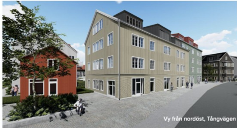
Vy från nordöst, Tångvägen