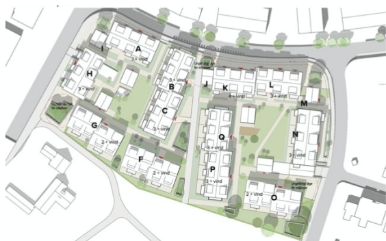
Bild 13. Situationsplan över projekt Bagarmästaren (Etikhus, 2023).