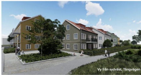
Vy från sydväst, Tångvägen