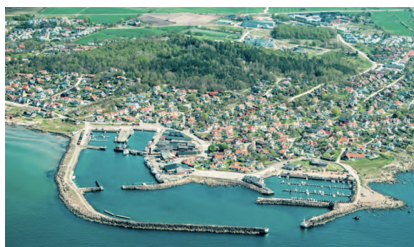
Bild 8. Knarråsen bakom bebyggelsen i Träslövsläge (Varbergs kommun, 2022).