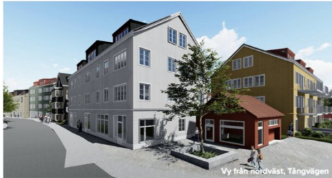
Vy från nordväst, Tångvägen