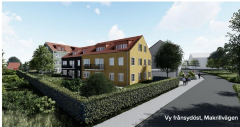
Vy från sydöst, Makrillvägen