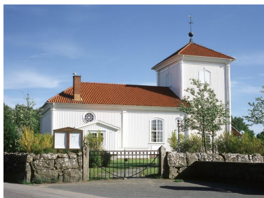
Bild 6. Kyrkan som är ett viktigt landmärke för Träslövsläge (Svenska kyrkan, 2023).