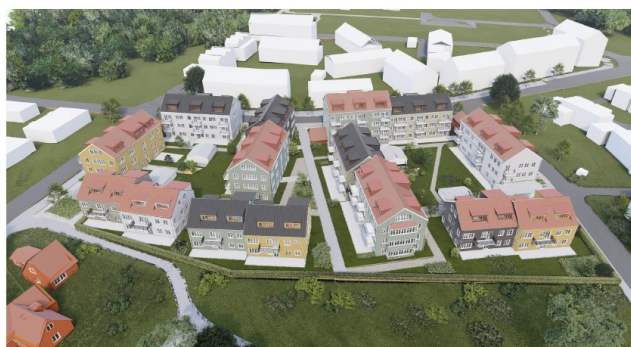
Bild 14: Översiktsvy från söder över projekt Bagarmästaren (Etikhus, 2023).

Bostadsrätterna som ska byggas är från en till fyra rum och kök och upprättas i syfte som permanenta bostäder. Målet är att skapa bostadsrätter med goda förutsättningar för generationsboende vilket möjliggörs genom mindre lägenheter som ligger i anslutning till gemensamt kök och badrum. Det är även planerat att bygga bokaler på markplan. Bokalerna är utrymmen avsedda för att bedriva verksamhet och är tänkta att bli ungefär 35 kvm stora och säljas i kombination med en lägenhet i huset. Att fortsatt bedriva verksamheter grundas delvis på att bevara och utveckla centrumkaraktären som finns på platsen idag (Etikhus, uå).