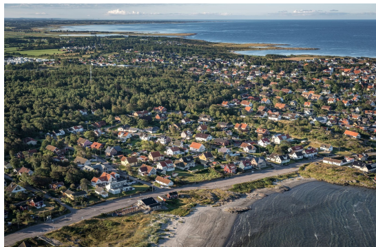
Bild 4. Flygbild över bebyggelse mellan hav och Knarråsen (Per Pixel Petersson, 2016).