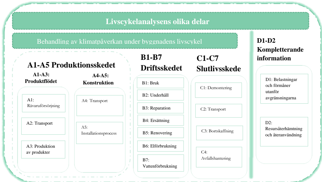
Figur 2: Exempel på flödesschema [5]

byggnaden består av [8]. För att därmed motverka för de fel som kan återspeglas i analysen om datan innehåller overifierad information. Listan med osäkerheter i datainsamlingen kan bli lång därför ingår en del riktlinjer och regler i EN-15978 för att felmarginalen som uppstår vid analysen ska vara liknande för alla analyser [6]. En transparens kring de antaganden som görs i analysen ska finnas med i rapporteringen för att läsaren ska få möjlighet att avgöra rimligheten i antagandena. Vart den samlade datan är tagen ifrån ska också redovisas.