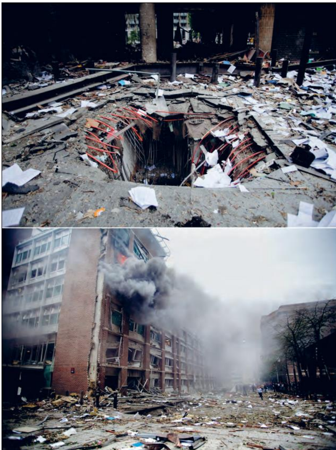
Figur 2.2: Bild på krater skapad av bilbomben samt skador på närliggande byggnader (Gjørv 2012, figur 18.2, sid. 413).

CBRN: Kemiska biologiska, radiologiska och nukleära attentat kallas CBRN-attentat och kan enligt MSB (MSB, 2019, sid. 25) orsaka "...stor skada och stora störningar...". Vidare beskrivs att det inte tidigare har inträffat något CBRN-attentat i Sverige men att det är fullt möjligt att ett sådant attentat sker i framtiden. Vad gäller anledningen till varför dessa typer av attentat inte tidigare skett menar MSB att det grundar sig i att det finns andra attentatsmetoder som är mer pålitliga, säkrare och